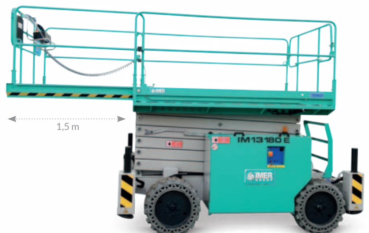
Manuelle Plattformverlängerung von 1,5 m für eine Gesamtlänge von 4,2 m