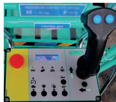
Quadro comandi sulla piattaforma con pulsanti capacitivi: semplicità e sicurezza di utilizzo