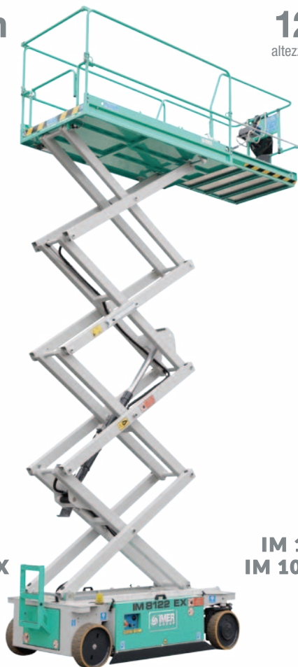
IM 8122 IM 8122 EX